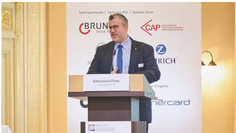
Le vice-président de la FSFP pendant son exposé au Forum «Sécurité intérieure» à Berne.

Ma motivation première réside dans la défense des intérêts des policières et policiers. Avoir de bonnes conditions de travail, et en particulier un bon équilibre entre la vie professionnelle et la vie privée est très important